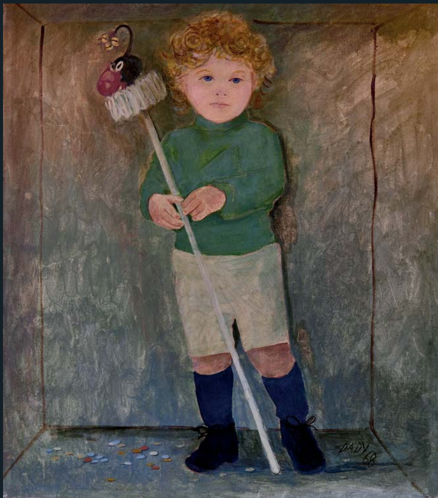
Fanciullo 1968 terre su tela cm 80x70