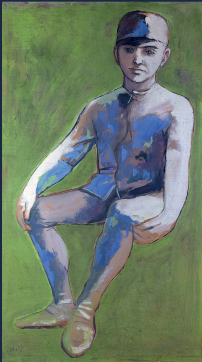
Figura maschile 1957 terre su tela cm 67x57