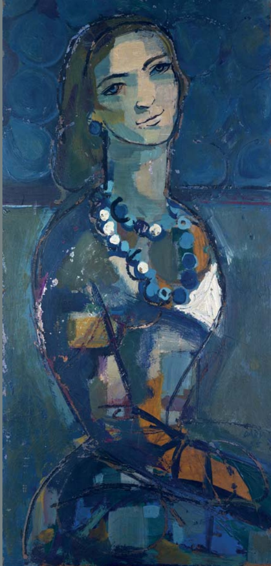
Figura femminile 1950 terre su legno cm 70x34